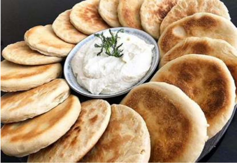
Arepas andinas. Fuente: https://www.instagram.com/chefluis-maldonado/ .

Al respecto, Sánchez (2019) en su trabajo titulado Tesoros de la cocina tradicional tachireNSE , nos explica: