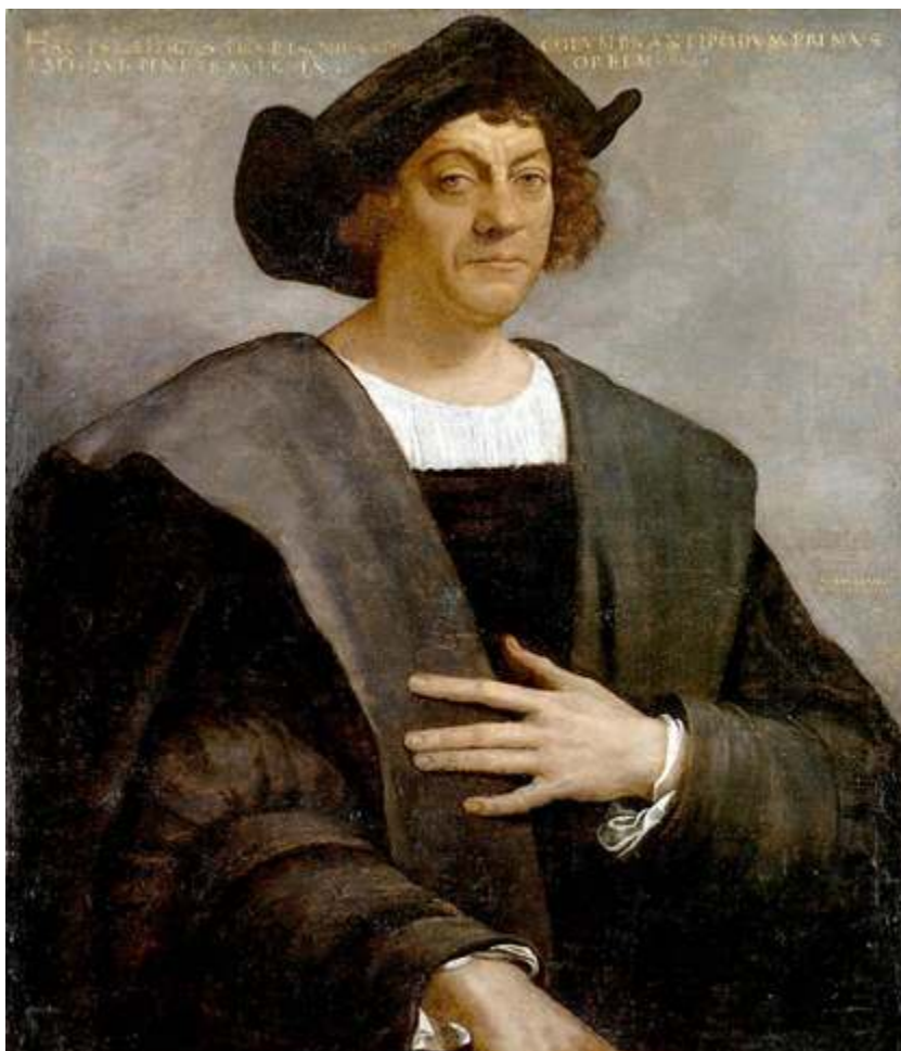
Retrato póstumo de Cristóbal Colón por Sebastiano del Piombo, 1519. No se conocen retratos auténticos de Colón.

Luis de Carvajal y al famoso médico doctor Francisco Hernández» 6 .