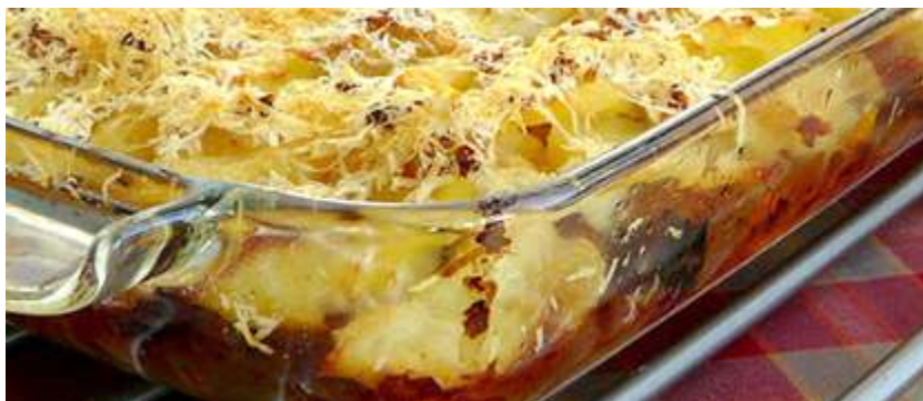
Turmada de papas parameras.

Entre las antiguas costumbres tachirenses de hacer comidas, con un toque especial, el día viernes, día que, para el pueblo judío, representa la víspera del día de descanso el shabat . Sánchez (2019), al referirse a un plato típico de La Grita y Pregonero, recuerda: