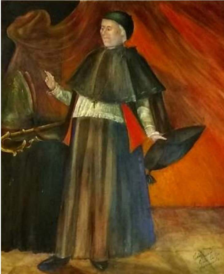
Don Mariano Martí Estadela, Obispo de la Provincia de Venezuela.

ros y siempre descansando sobre los lomos del ganado. Este corazón, reducido a polvo o polvificado, y con una única poción, en cualquier licor, despertaba la pasión amorosa y lograba rendir a la persona deseada 60 .