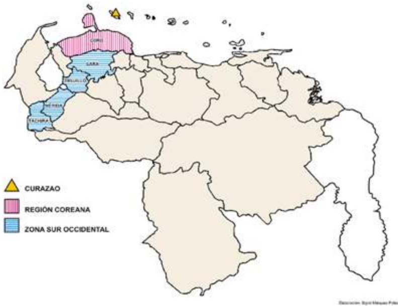
Eje Curazao – Región Coriana – Zona Sur Occidental del comercio entre las Antillas y Venezuela. Elaboración: Sigrid Márquez Poleo. 2019.

ter originario hebreo de muchas de esas tradiciones. Estos migrantes se asentaron principalmente en ciudades como Caracas, Maracaibo, Coro, y dispersamente en otras zonas del territorio como Los Andes venezolanos, donde a través de las épocas ha habido presencia judía, pero de manera incipiente y sin señales de colectividad, la cual sólo se concretó a principios de la década de 1930.