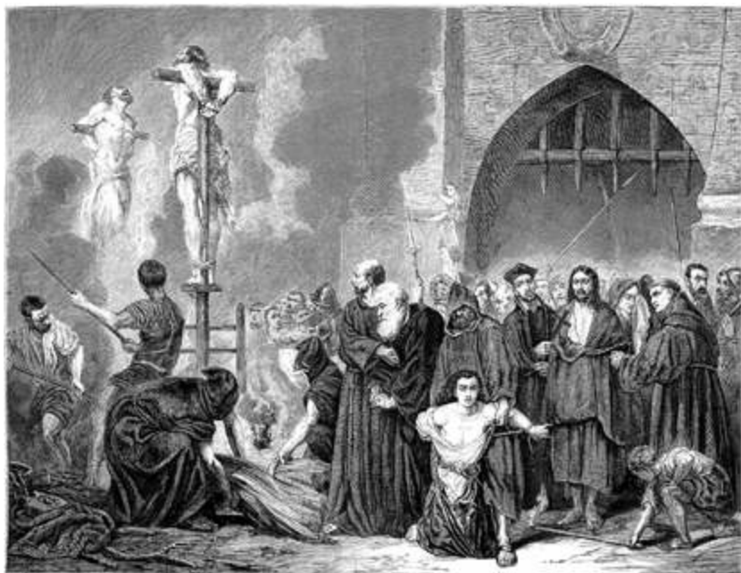
Un auto de fe. (Cuadro de M. Robert Fleury) H. Linton sc. Bocort dt. Fuente: https://wellcomecollection.org/works/mjwa6gf4 .

SÓLO, EN ÉPOCAS RECIENTES, los judíos no se preocupan en ocultar su condición, en tiempos pretéritos, en toda la América con el acecho de la Inquisición española ser discreto no bastaba, pues no sólo se les estaba vedado vivir en «las Indias» sino que también a varios les costó la vida.