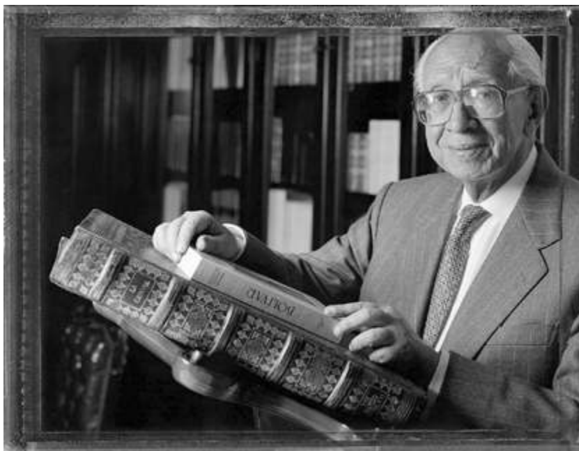
Ramón J. Velásquez.

el lenguaje judeoespañol 53 , lengua hablada por los judíos que vivían en los reinos de España, antes de la expulsión, y que poco se diferencia del castellano del siglo XV.