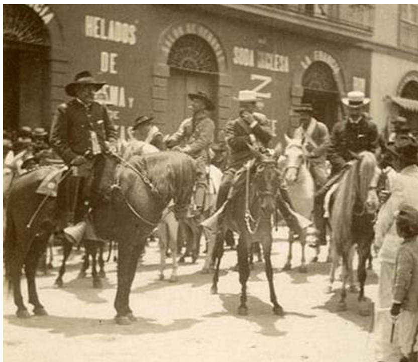
Cipriano Castro, 1900.

entre otras acepciones que «... en las provincias de la meseta castellana en el año cuatrocientos es sinónimo para decir judío, y que mil años después señaló a los Judíos conversos, expulsados de España [...] porque seguían cumpliendo a escondidas con su ceremonias y costumbres prohibidas por la liturgia católica [...] Encontré además –dice la investigadora– que Alejandro Borgia, el Sumo Pontífice proveniente de la familia Borja de Xátiva, en Valencia España, era dado a los gochos en la liturgia popular de su tierra, y por ello fueron llamados esos cantos los gochos del Papa Alejandro , y luego en juego de palabras el jerarca fue llamado el Papa de los gochos por haberle dado asilo a los judíos...».