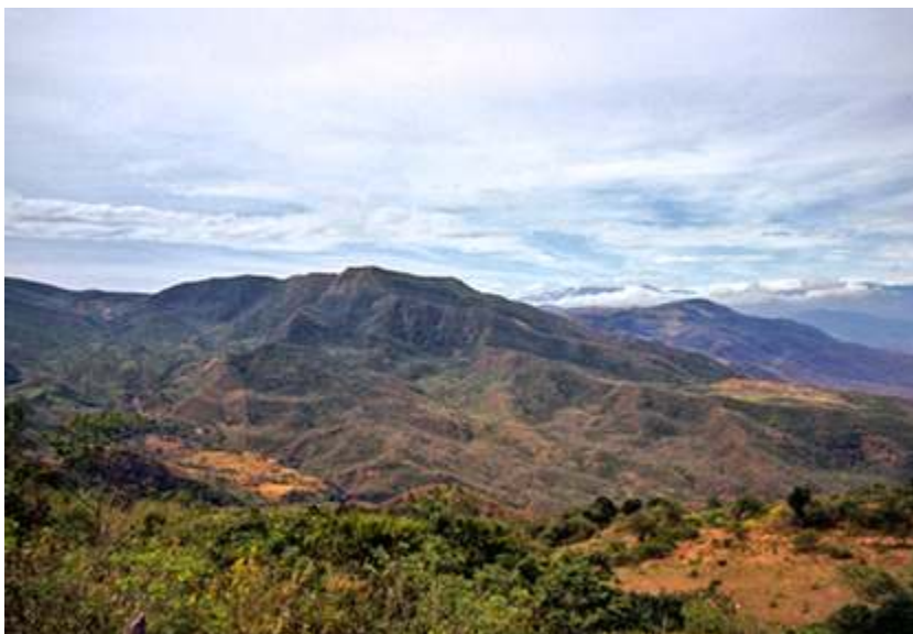
Pico "El Judío".