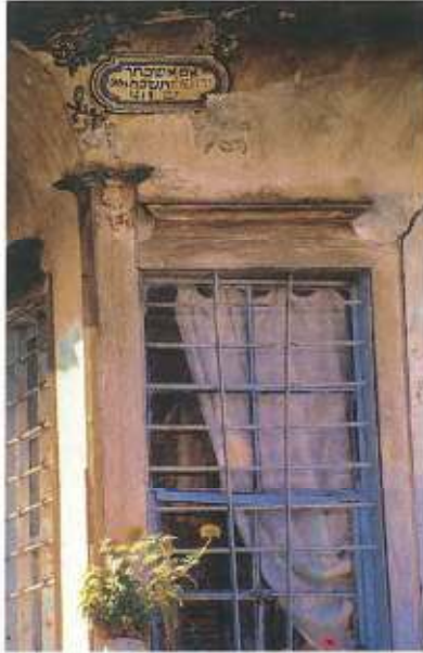
A hebrew inscription on a house of "Barbouta", built in 1859 (5619)

בית הקברות היהודי שכן בגדה המערבית של נהר הטריפוטמיס, מול ברבוטה, במרחק של 500 מטר. זהו מקרה מעניין, משום שאנו נמצאים מול התופעה המסורתית, בה רובע המגורים ובית הקברות מופרדים על ידי פלג מים.