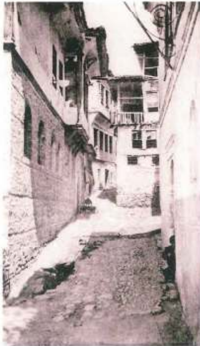
The Jewish quarter pictured in an old postal card

למעלה: כיתוב בעברית על אחד הבתים ברובע ברבוטה שנבנה בשנת 1859 (5619)