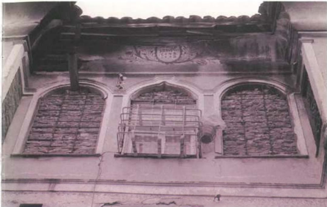
Old Jewish house built in 1882 (5642)