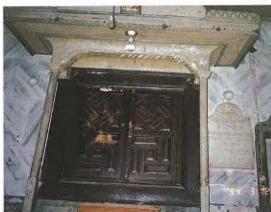
The Eichel of the Synagogue before the restoration