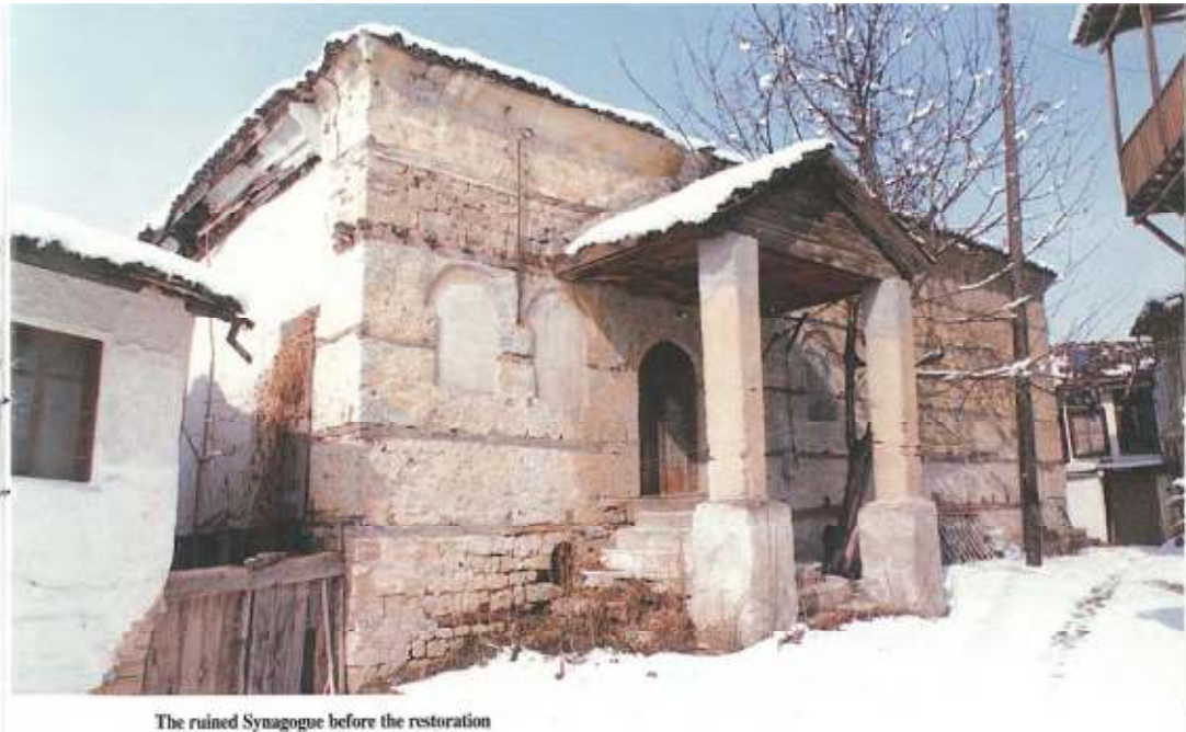
The ruined Synagogue before the restoration