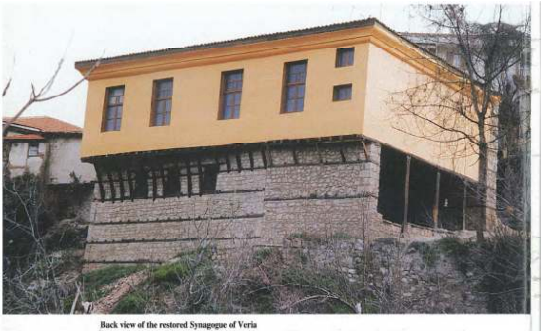
Back view of the restored Synagogue of Veria