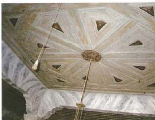
Detail of the ceiling of the Synagogue before restoration

בעיות השחזור נבעו מההרס הטבעי והתיישנות החומרים, היעדר התחזוקה ובעיקר, מהלחות שחדרה בחלקים מסוימים בגג, בעקבות תזוזת הרעפים והבלאי של השכבה החיצונית.