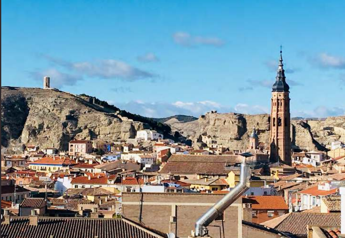
Vista del barrio de la judería, Torremocha y el Castillo de Constant