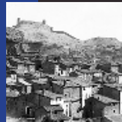
Vista antigua del barrio judío y Iglesia de Consolación (antigua Sinagoga Mayor) antes de la restauración Año 1934 Antonio Passaporte