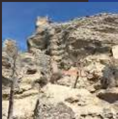
Muro de cierre de la judería en el barrio de la Coracha

La “ carrera de la Coracha ” se corresponde con la actual calle de Consolación. Su longitud iba desde la muralla Oeste (junto a la puerta de la Furiega) hasta el barrio de Villanueva. Al Norte lindaba con los barrios de la Paprota y Sinagoga Mayor. Al Sur estaba el barrio del Barranco Alto, que discurría paralela a ella.