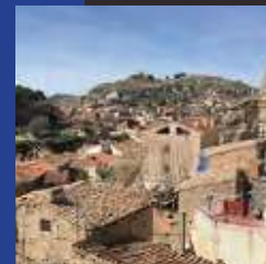
Vista de la judería desde el balcón del portillo de la Torremocha