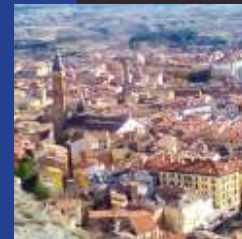
Vista de Calatayud desde la Torremocha