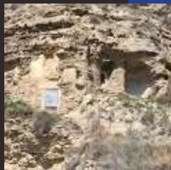
Vistas casas cuevas en el barrio de la Paprota