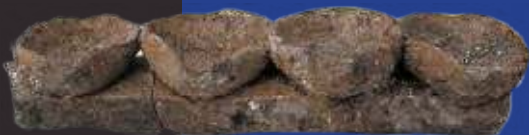
Hanukiyah: Fracmento de lámpara judía para la purificació del Templo año 165 a. C

Su extensión abarcaba desde la plaza de la judería (actual Plaza de Santa Ana) hasta la "carrera de la Coracha" (actual calle de Consolación). Al Norte limitaba con el barrio de la Paprota y al Sur con el de la Coracha.