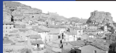
Vista general de la judería y del Castillo de Constant o Doña Martina en 1934. Antonio Passaporte.

La casa donde bañan a los muertos estaba en el Barrio de Burgimalaco, junto a la sinagoga Menor. En 1492 fueron inventariados los enseres que había dentro de ella.