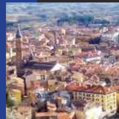
Vista de Calatayud desde la Torremocha