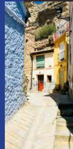
Barrio de la judería en la actualidad.