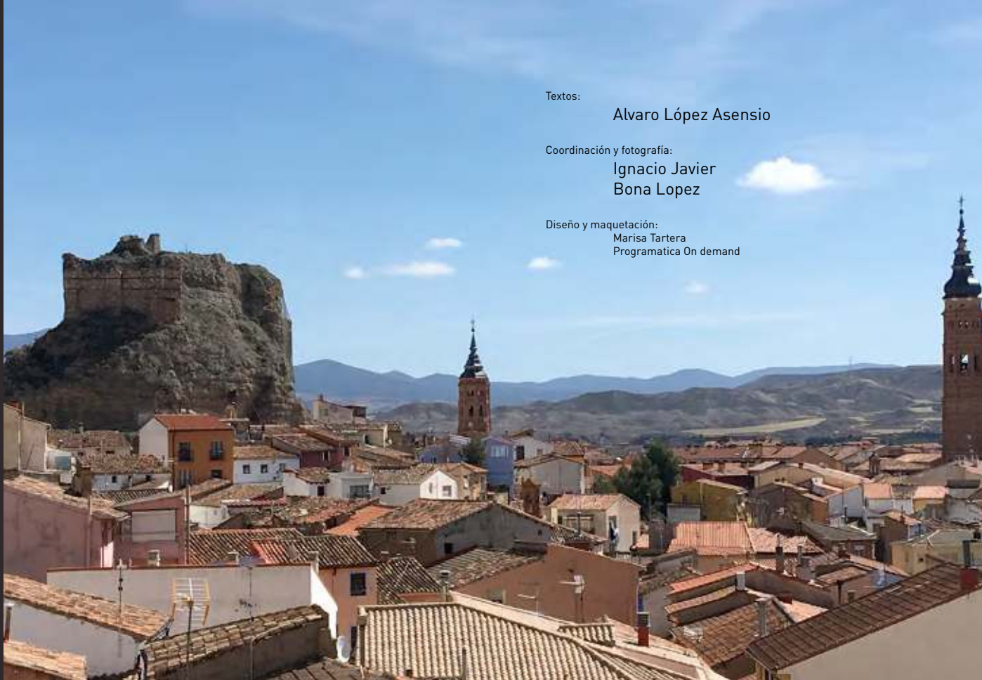
Vista lateral de Castillo de Constat o de los judíos, después llamado de Doña Martina o de Don Álvaro.

דבובק Rabbin Moys ben Nahamon דבינו כוש בר נחמן קצור רבנים לספר תורת הארם