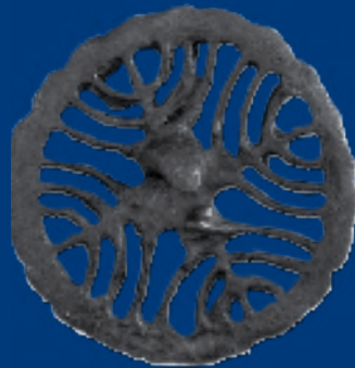
Sello de bronce Procedente de la judería de Calatayud depositado en el Museo de Creencias y Religiosidad Popular Abizanda - Huesca

El "Postigo de Torremocha": En el año 1264, Jaime I mandó cerrar con un muro el castillo de Torremocha y el de Constant, construyéndose un postigo que daba acceso al "barrio de vallupié" o Barranco de Soria.