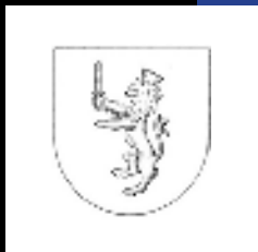
Emblema de la familia Alconstantini de Calatayud