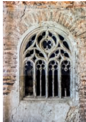
Sinagoga de los Ibañez

Plazas limitadas. Recogida de invitaciones en el Centro de Recepción de Visitantes (Azoguejo, 1)